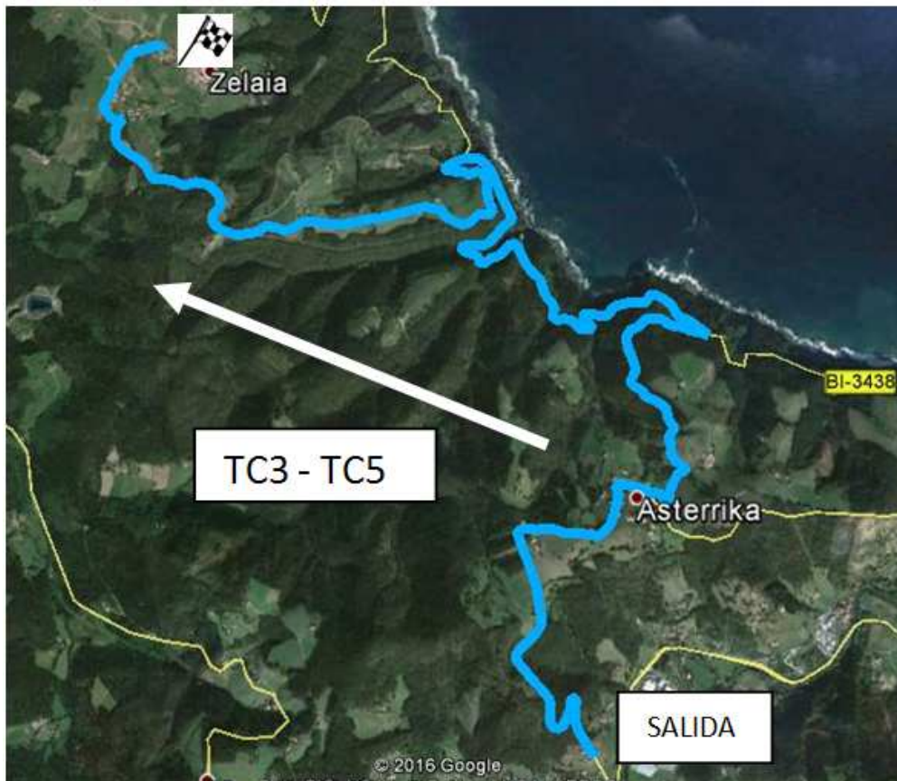
Tramo cronometrado D: Ispaster – Nabarniz