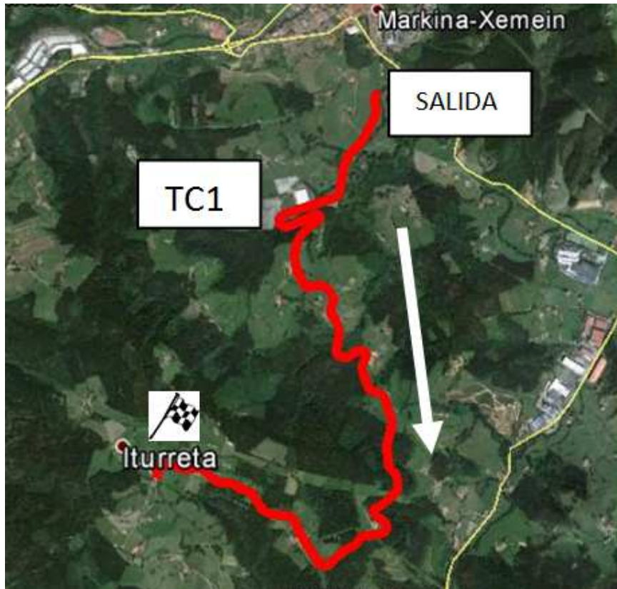
Tramo cronometrado B: Aginaga (Eibar) - Etxebarria